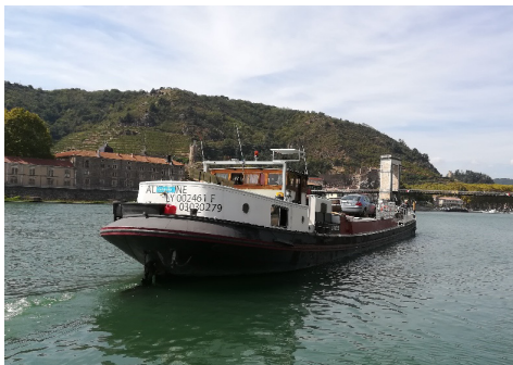
Péniche "Canalien" en septembre