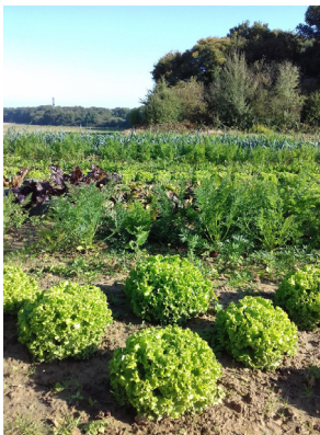
ça pousse à merveille dans le «Potager naturel» de Serge

Serge prévoit 2 distributions par mois aux dates indiquées sur le contrat. Il reste des contrats disponibles, si vous souhaitez rejoindre l'aventure.