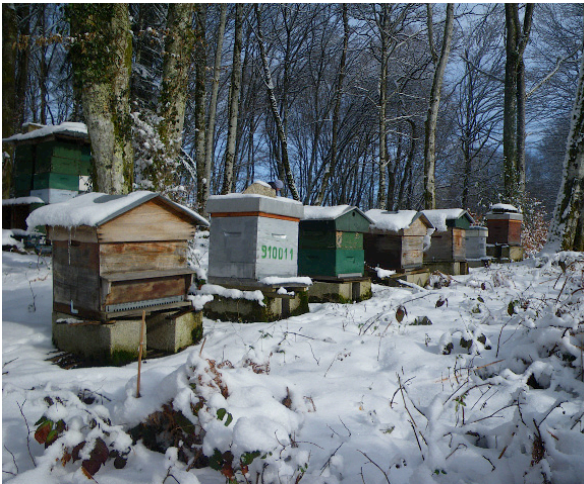
Rucher du Morvan mars 2013.

L'hiver est encore bien là, le retour brutal du froid m'a stoppé dans mes débuts de visites post-hivernales. Les ruches du Morvan pour l'instant ont toutes passé les grands froids. En vallée de Chevreuse les pertes sont raisonnables et varient suivant les ruchers, mais il est trop tôt pour faire le bilan, et je ne suis pas encore allé en Gironde.