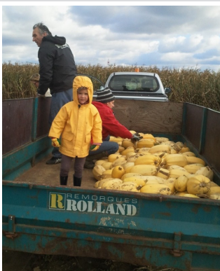
Récolte des courges

Malgré une météo du jour fort peu agréable et une suite d'annulations et de re-programmations de dernière minute, vous avez été présents et sans vous, je n'aurais pu assurer la sauvegarde de la récolte.