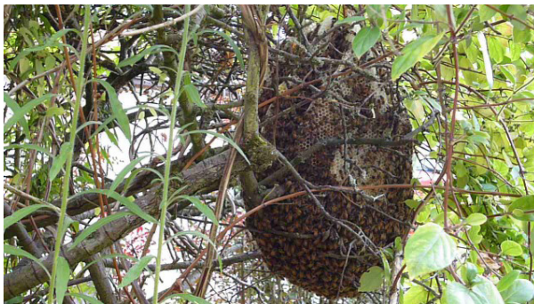
essaïm sauvage installé dans une haie pour l'hiver, récupéré et désormais bien au chaud dans une ruche