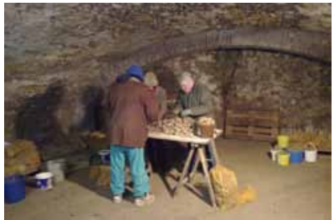
Dégermage des pommes de terre, variété Altesse

Nous vous invitons donc cet après-midi à venir au stand dans la cave pour emporter le reliquat de votre contrat récolte 2011 (prévoyez les sacs nécessaires).