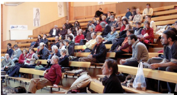
Une centaine d'Amapiens ont participé à notre AG...